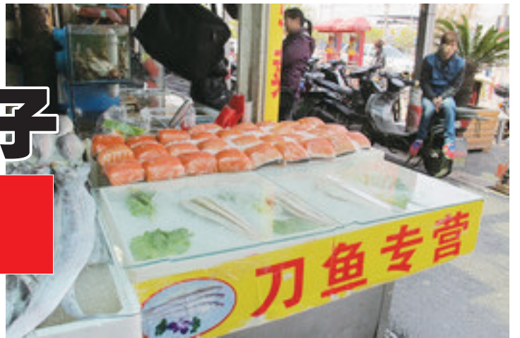
长江刀鱼的价格从220美元回落至13美元。

影响似乎就是消费者支出的下降，特别是高端消费。比如，根据中国烹饪协会的数据，2013年年初假期期间的宴请餐饮业收入较上年同期有所下降，这在25年来尚属首次。需求重心似乎已从豪华餐馆转向了比较朴素的餐馆。